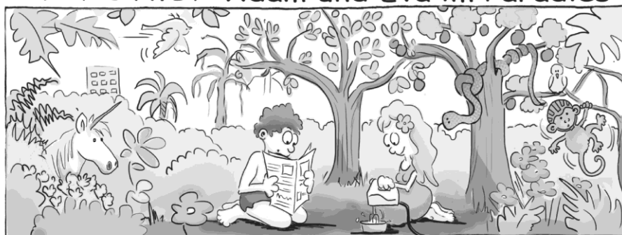
(Einhorn, Hochhaus, Vogel verkehrt herum, Handmixer, Knoten in Schlange, Affe mit Helm)