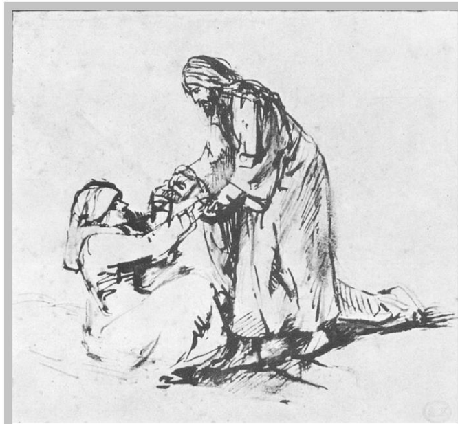
Rembrandt van Rijn, Die Heilung der Schwiegermutter des Petrus

Alle wollen etwas von Jesus. Kein Wunder. Sie warten auf Wunder. Sie erwarten Heilung, also Trost und Stärkung. Wer heute mit seinem Elend nach Lourdes fährt, will gesund werden, natürlich. Und wenn er nicht gesund wird, fühlt er manchmal doch Heilung. Weil man so darauf wartet, sich so danach sehnt. Weil man es Gott oder der Jungfrau zutraut. Weil man zwar krank wieder wegfährt, wie man auch kam, sich aber doch anders fühlt: geheilter. Weil die Seele weniger schmerzt. Wer auf Gott hofft, kann auch erkennen, wenn er nahe ist.